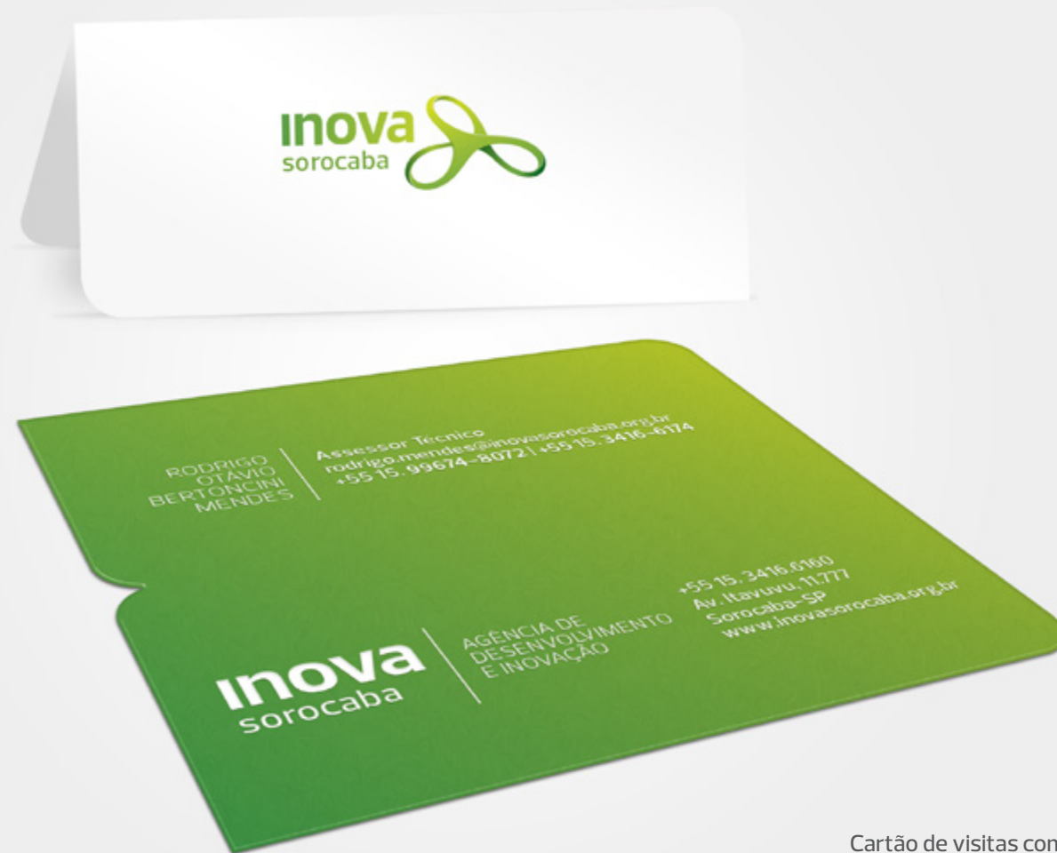
Cartão de visitas com dobra