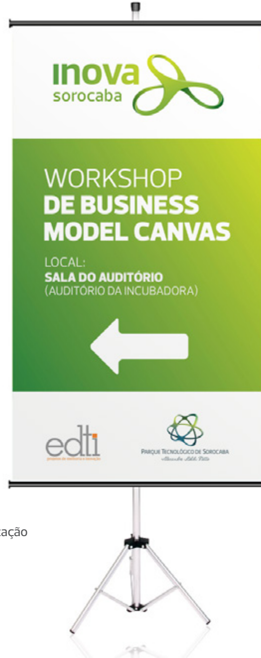
Banners de sinalização